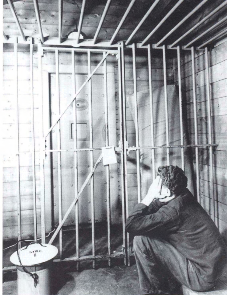
Strafcel uit 1952. In de hoek de strozak waar de gevangene overdag niet op mocht liggen.

Door de steviger greep op de strafrechtspleging werd verbanning binnen de Republiek dan ook allengs ervaren als weinig zinvol en kwam confinement (gevangenisstraf) daarvoor in de plaats. De ergste vormen van doodstraf, waaronder radbraken, verbranding en dergelijke waren al aan het eind van de achttiende eeuw verdwenen. Daar-