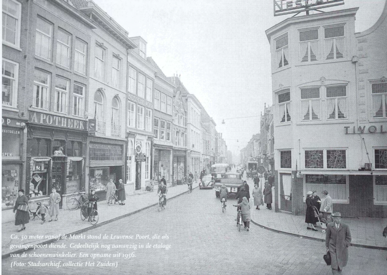
Ca. 50 meter vanaf de Markt stond de Leuvense Poort, die als gevangendoor diende. Gedeeltelijk nog aanwezig in de etalage van de schoenenwinkelier. Een opname uit 1956.

poort immers meer ruimte om gedetineerden te huisvesten. Groot was de strafinrichting niet, want zowel op de eerste als op de tweede verdieping bevonden zich slechts vier opberghokken, waar licht en lucht spaarzaam binnendrongen. In elke cel stond een aantal houten kribben met stro. Erger was het in de onderaardse diefput of 'gayool' waar de onhandelbare gedetineerden voor straf werden opgesloten. Binnen deze volkomen duisternis ontbrak elke voorziening en wentelden de gestraften zich bij wijze van spreken in hun eigen drek. Vluchtgevaarlijke sujetten konden bovendien nog met een ketting aan een blok aan de grond worden vastgeketend, zelfs halskragen waren niet ongebruikelijk. 2 Over het lot van de uitgestoten bekommerde men zich in voorgaande eeuwen niet of nauwelijks.